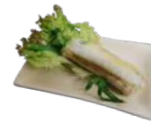
38 Sommerrolle Tofu, Reismudeln, Gurke, Mango, Salat / tofu, rice noodles, cucumber, mango, lettuce